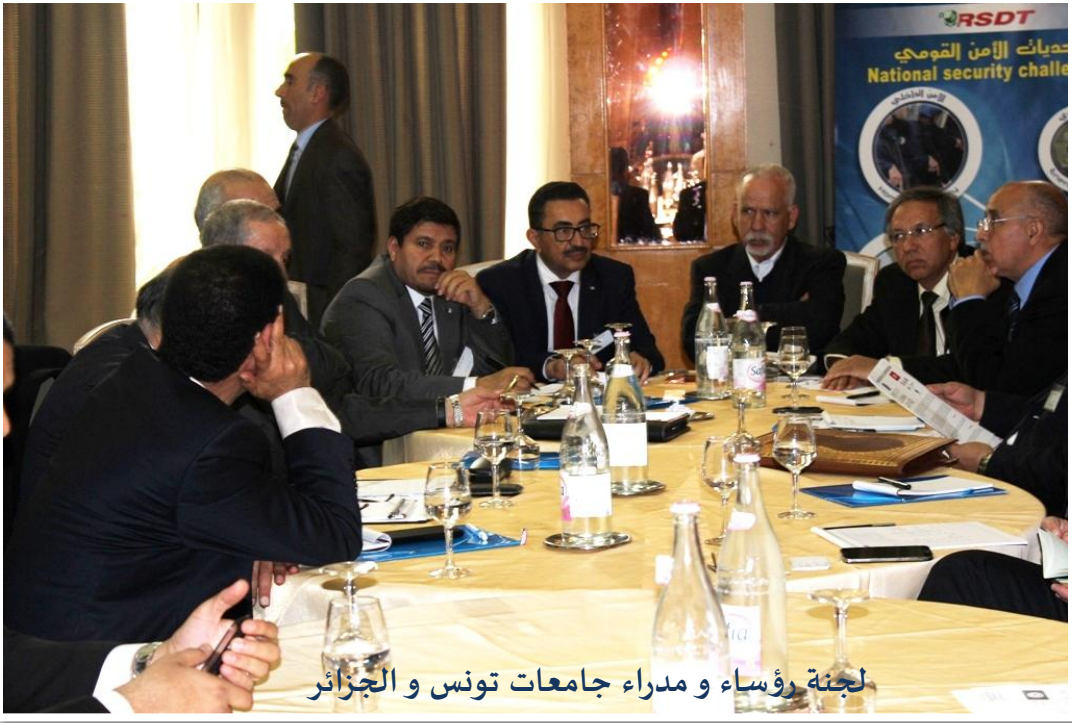
لجنة رؤساء و مدراء جامعات تونس و الجزائر

عرفت أشغال اللجنة الموسعة الجزائرية التونسية تشكيل 03 لجان مشتركة :