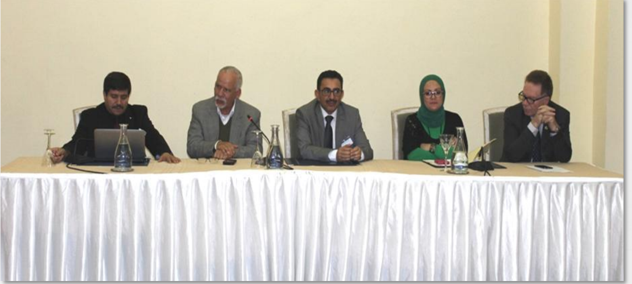
لجنة صياغة تقارير اللجان المشتركة الجزائرية التونسية

أما بخصوص ندوة مدراء مراكز البحث العلمي فقد خلصت إلى الاتفاق على تحديد أربعة محاور تكون مجالاً للتعاون المشترك بين البلدين تتمثل في "الأمن الغذائي والصحة والبيئة وعلوم وتكنولوجيات الاتصال والطاقة وعلوم المواد بالإضافة إلى العلوم الإنسانية والاجتماعية في مواجهة التحديات الراهنة.