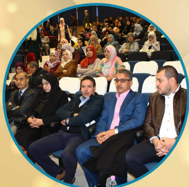
الملتقى الوطني السابع حول تسيير الموارد البشرية - ص 19