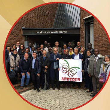
مدير جامعة بسكرة يشارك في فعاليات الملتقى الختامي لمشروع AFREQEN بياجيك - ص 30