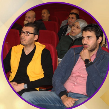
دورة تكوينية للأساتذة الموظفين منذ سنة 2013 - ص 20