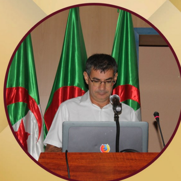
ملتقى دولي حول الأدب الرقمي ص 12